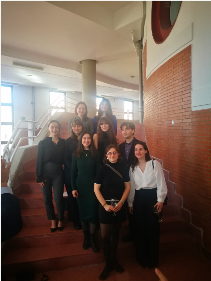
Summer School 2025

FORMATIONS : DROIT • SCIENCES POLITIQUES ÉCONOMIE • GESTION • INFORMATION - COMMUNICATION